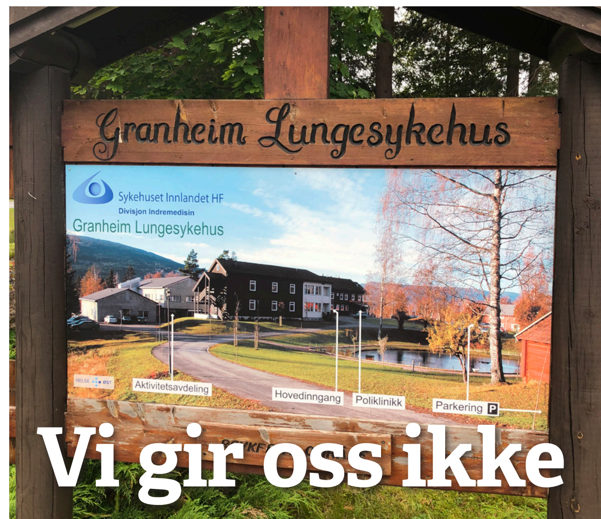
Foreløbig reddet: Rødt vil sikre et fullverdig helsetilbud i Innlandet.

Når det gjelder samlokalisering av somatikk og