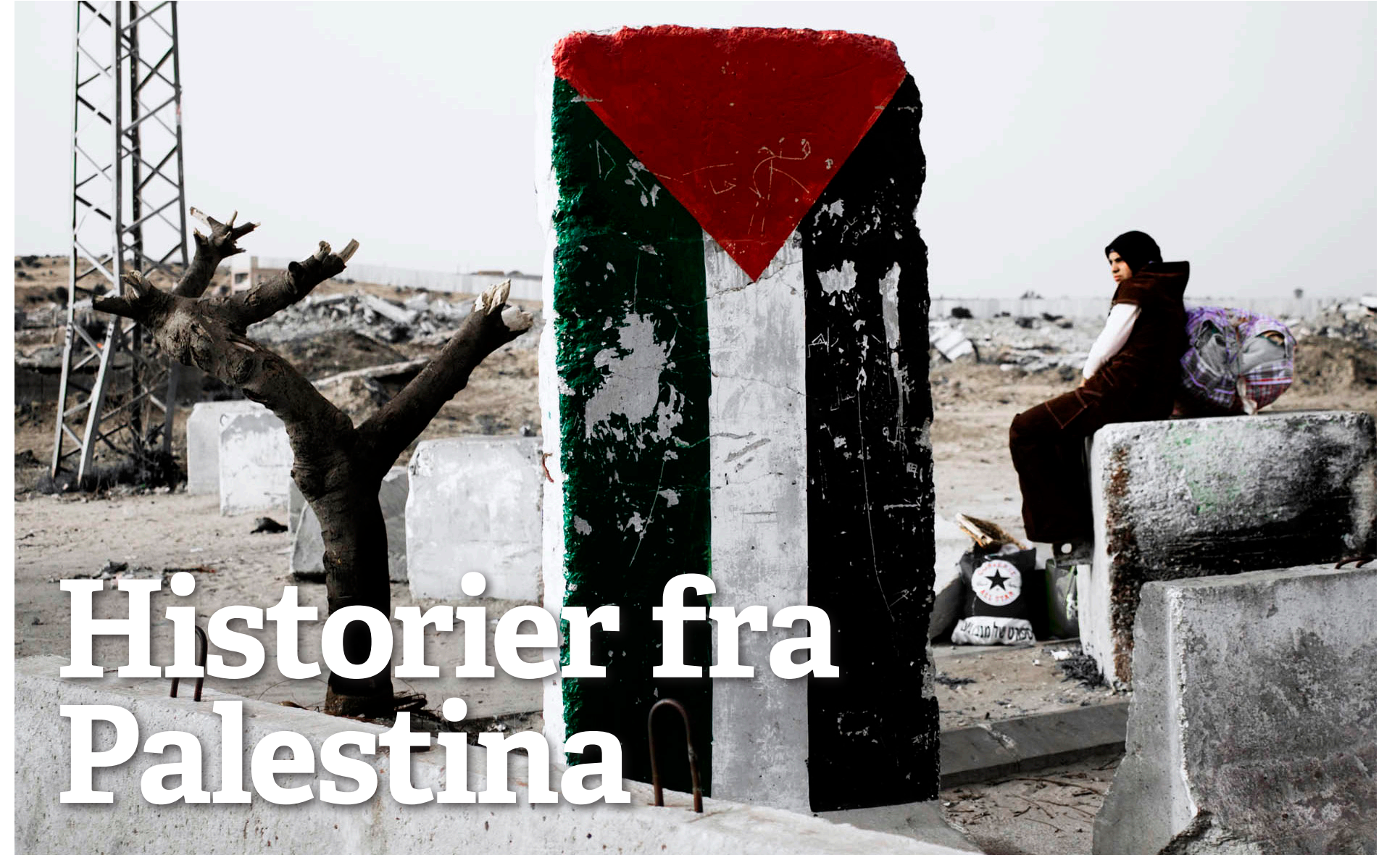
Solidaritet: Rødt støtter frigjøring av Palestina.

– Rødt mener Forsvaret skal forsvare Norge, ikke militærkuppregimer i utlandet. NATO-krigen mot Libya har allerede destabilisert store deler av Afrika, inkludert Mali, og mer vestlig krigføring skaper bare mer lidelse for befolkningen. Det er grovt uansvarlig å sende norske soldater i livsfare og bruke skattemillioner på å krige for vestlige stormaktsinteresser i Afrika, sier Aydar