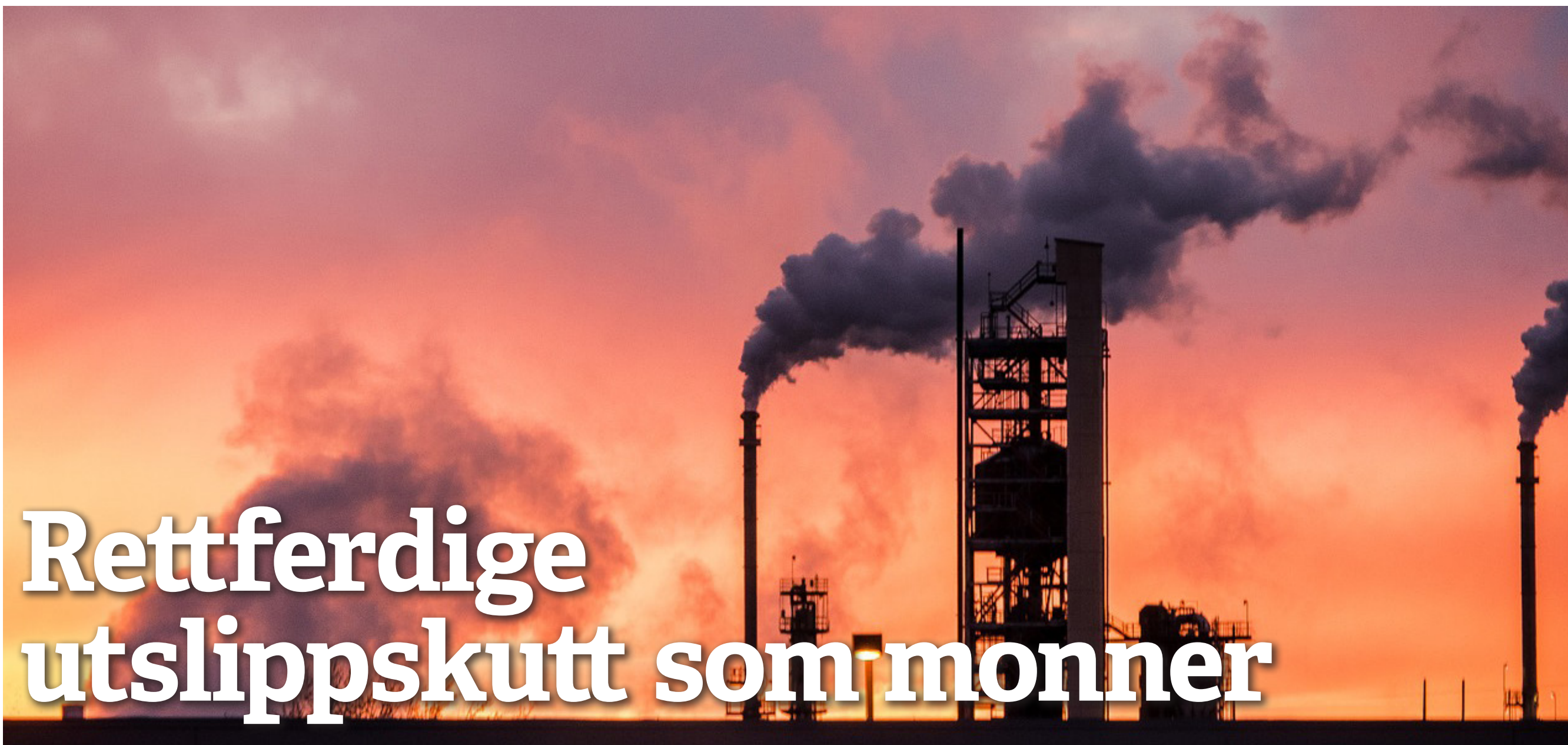
Vil kutte utslipp: Røds har en plan for rettferdige utlippskutt som monner.

Biolog Dag Hessen har sagt ord på det: Det viktigste er ikke å restaurere naturen – men å la være å ødelegge den!