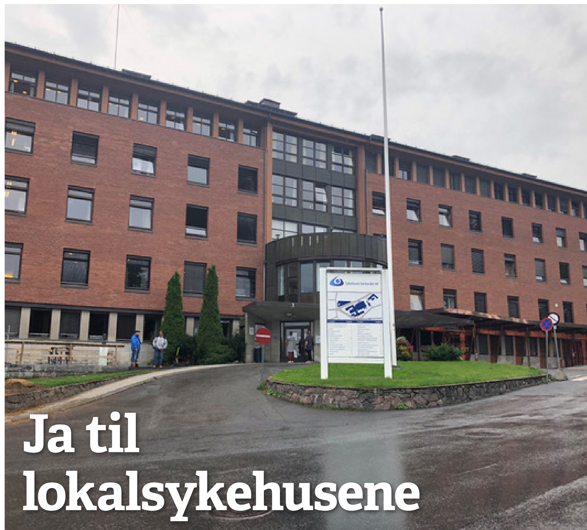
Ja til lokalsykehus: Rødt vil sikre et fullverdig helsetilbud i Innlandet.