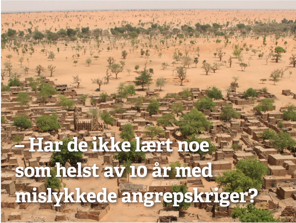
Mali: Telly-landsbyen ved Bandiagaraklippen.

Nå må vi ta ansvaret ved å innse nederlaget og hjelpe til med opprydding og støtte til alle flyktingene, inkludert å hjelpe alle afghanerne som har bistått Norge der nede. De vil kunne bli kalt quislinger av Taliban. De går en svært usikker framtid i møte.