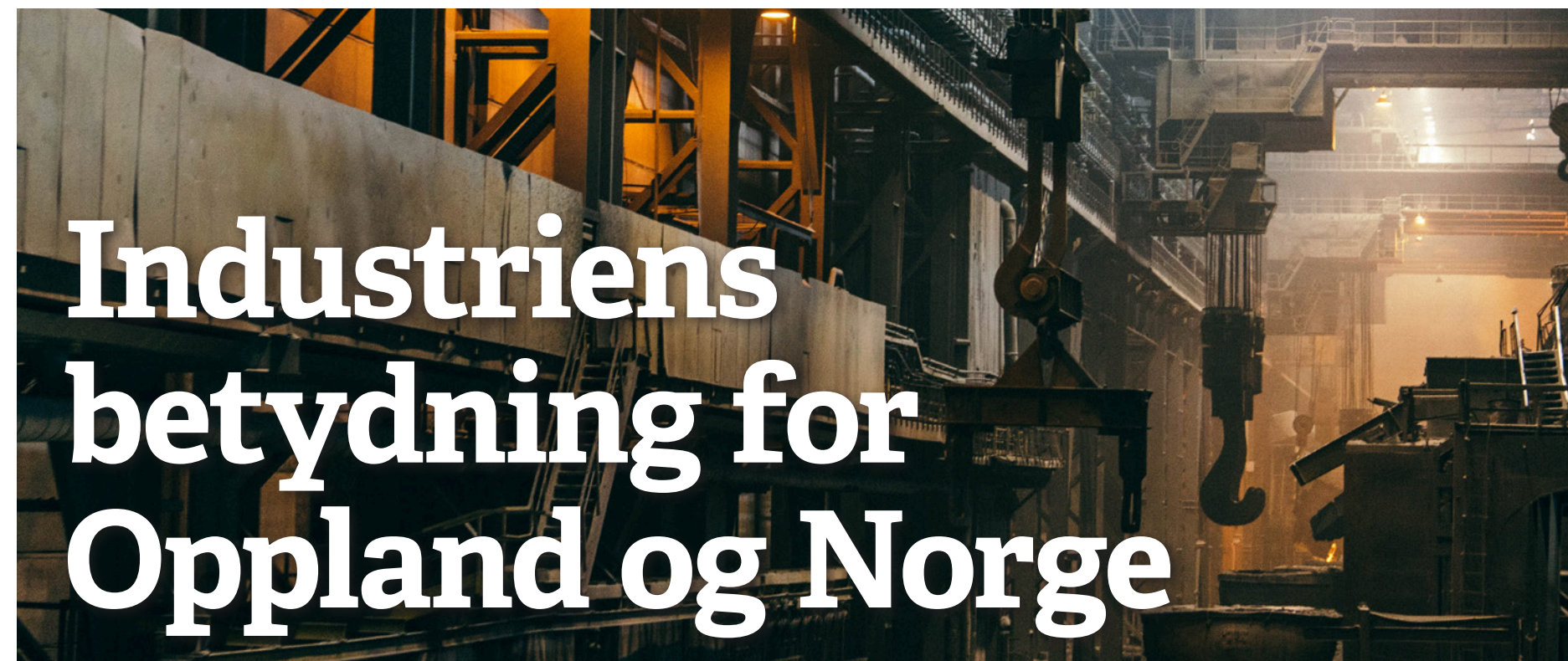
Vil satse på aktiv industripolitikk: Rødt mener vi må bruke deler av oljefondet på investeringer her hjemme.