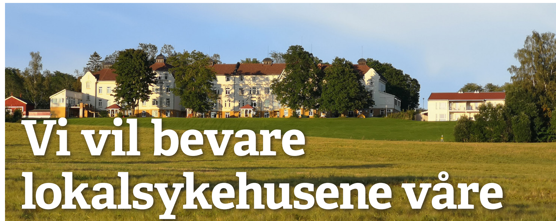
Sykehus: Rødt vil også bevare sykehusene på Reinsvoll og Gjøvik.