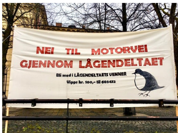
Vil bevare: Rødt sier nei til motorvei.