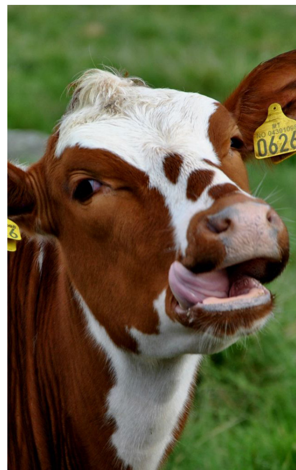
Styrk det norske landbruket: Rødt vil sikre norsk lambruk gode vilkår.

Alt for lenge har andre skummet fløten av bøndenes arbeid. Og skiftende regjeringer har snakka om hvor komplisert jordbrukspolitikken er. Men det er ikke så vanskelig: vi skal produsere norsk mat på norske naturressurser. Og sørge for at de som produserer maten, har ei lønn å leve av. Det går Rødt til valg på.